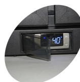
Ochronna pokrywa termostatowa